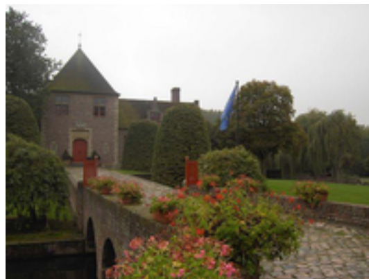
Afbeelding 26: Axelwalle

Axelwalle is de reconstructie van een gelijknamig middeleeuws kasteel. Het ligt in het noorden van Heurne, deelgemeente van Oudenaarde, nabij Zingem, deelgemeente van Kruisem. Heurne groeide samen met Eine uit tot een heerlijkheid en herbergde ook de afzonderlijke heerlijkheid Axelwalle, die banden had met Heestert in Zwevegem en Moregem. Tegenwoordig herinnert een straatnaam in Heurne nog aan die heerlijkheid.