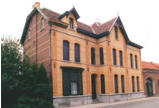
Afbeelding 7: Burgerhuis

Burgerhuis voorheen met stokerij Vandercruyssen opgericht in 1860 in een bestaande hoeve, in 1864 met stoom aangedreven. Stopgezet in de jaren 1950.