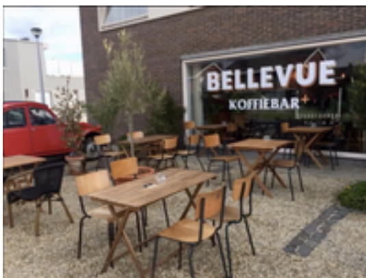
Afbeelding 25: Koffiebar Bellevue

In 't kort gezegd en geschreven... Na een carrière van 22 jaar als verpleegkundige en 10 jaar als traiteur "de