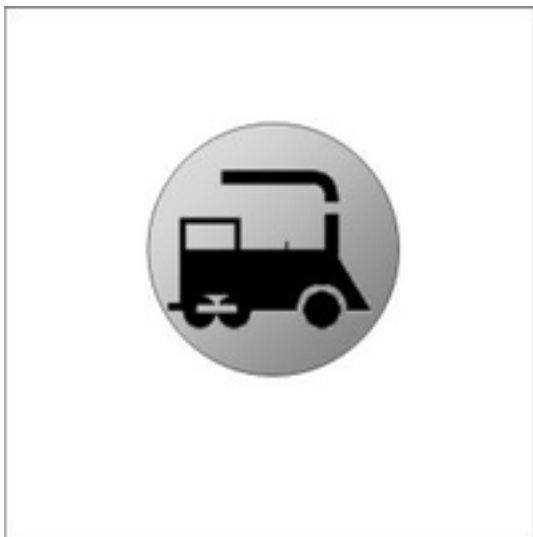
Afbeelding 14: Zingem