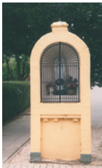
Afbeelding 10: Onze-Lieve-Vrouwekapel

Thans geelgeschilderde bakstenen pijlerkapel ingeplant in de as van de Voordestraat. Rondboogvormige getraliede nis met polychroom Onze-Lieve-Vrouwebeeldje. Bekronend topstuk en ijzeren kruis. Halfronde grijsgeschilderde achterzijde.