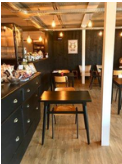
Afbeelding 23: Koffiebar Bellevue