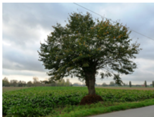
Afbeelding 29: Hoeklinde

Op basis van de kadastrale Popp-kaart van circa 1842-1880 lijkt er bij de aanleg van de Bekestraat een restperceeltje aan de andere kant van de weg te zijn ontstaan. De eigenaar heeft vermoedelijk zijn rechten op dit perceeltje willen kracht bijzetten door er een hoekboom te planten. Het betreft een oude linde met een stamomtrek van 220 cm (gemeten in 2017) en de boom werd geknot op een hoogte van 4 m.