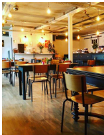
Afbeelding 22: Koffiebar Bellevue