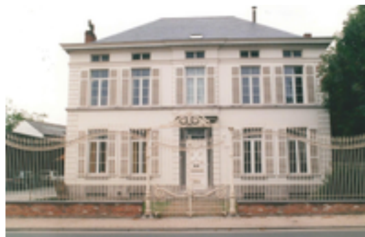
Afbeelding 9: Herenhuis

Herenhuis achter fraai ijzeren straathek met centraal dubbel hek aan gietijzeren zuilen met dito bekroning met voluten en vruchtenkelken, gebouwd op plaats van een gesloten hoeve.