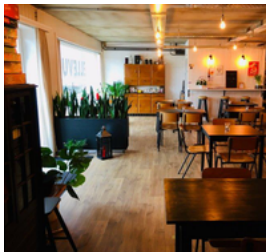
Afbeelding 21: Koffiebar Bellevue