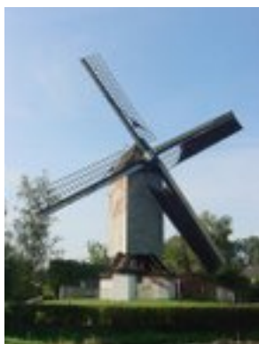
Afbeelding 1: Meuleken 't Dal