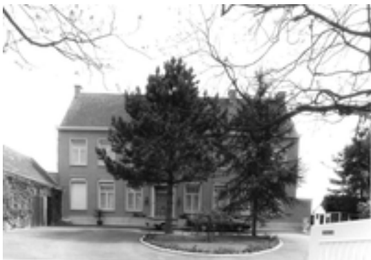
Afbeelding 18: Stokerij Vander Straaten

stokerijgebouwen (nokrichting parallel aan de straat) aansluitend bij de vroegere brouwerijgebouwen.