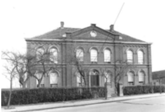
Afbeelding 3: Armhuis