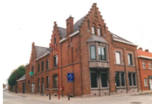
Afbeelding 6: Notariswoning