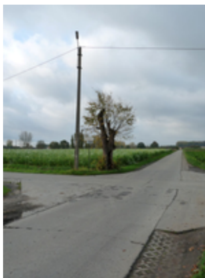
Afbeelding 27: Linde als kruispuntboom

Een oude linde is aangeplant bij het kruispunt Bekestraat - Maldegemstraat. Dit is een boom die als baken functioneerde en als wegmarkering voor reizigers nuttig was. Het betreft een oude Hollandse linde die inmiddels als veteranboom kan gezien worden. Mits aangepaste en goede verzorging kan deze linde nog lang blijven staan.