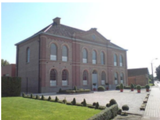
Afbeelding 4: Armhuis

Het Armhuis is een voormalig armenhuis in de tot de Oost-Vlaamse gemeente Gavere behorende plaats Asper, gelegen aan de Steenweg 1. Het huis werd in 1863 gesticht door Sabina De Grootte en het werd