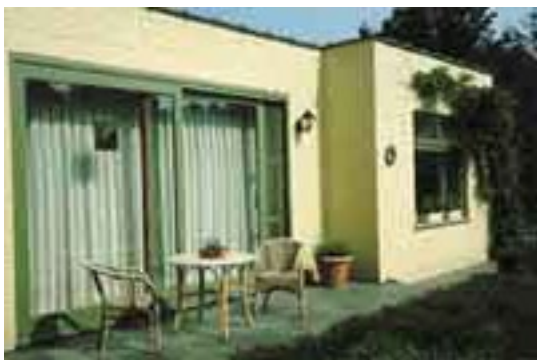
Afbeelding 19: 't Margrietje

Ruime vakantiewoning in de tuin van de eigenaar. Alle comfort is voorhanden. Handdoeken, lakens, verwarming en schoonmaak zijn in de prijs inbegrepen. Gelegen aan de rand van de Zwalmstreek en de Vlaamse Ardennen. Terras- en tuinmeubelen.