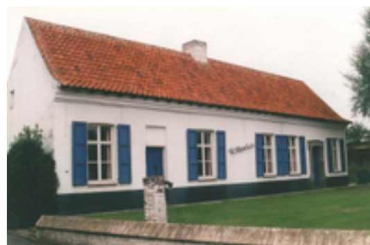
Afbeelding 5: Hoeve Romantica

Zogenaamd "Romantica". Gerenoveerd hoevetje met begraasd voorerf afgesloten door nieuw laag bakstenen muurtje. Woonhuis van zeven traveeën onder pannen zadeldak (nok parallel aan de straat) met rechter puntgevel afgewerkt met vlechtingen, opklimmend tot de 18de eeuw. Gewitte gevels op gepikte plint en aflijnende getrapte daklijst. Rechthoekige vensters met bewaard houtwerk en blauwgeschilderde luiken. Getoogde deur in gesinterde bakstenen omlijsting met neuten, oren en waterlijstje; eenvoudige deur met gedicht bovenlicht in tweede travee.