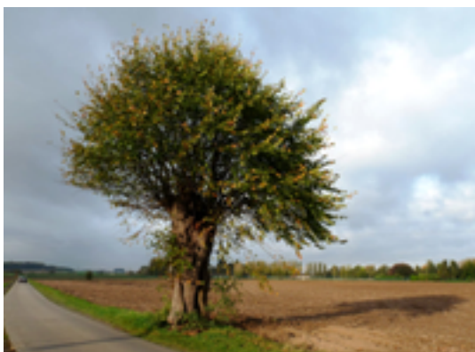
Afbeelding 28: Hoeklinde

Bij het raadplegen van de Popp-kaart van circa 1842-1880 kunnen we vermoeden dat er bij de aanleg van de Bekestraat een restperceeltje aan de