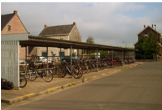
Afbeelding 16: Station Zingem

Station Zingem is een spoorwegstation langs