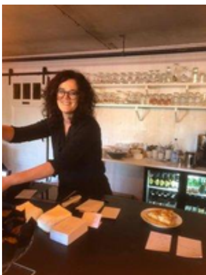
Afbeelding 24: Koffiebar Bellevue