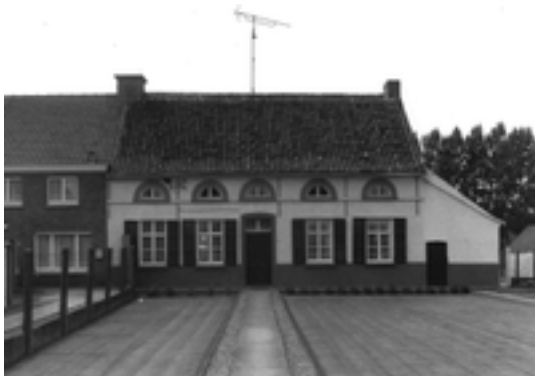
Afbeelding 11: Dorpswoning met stal

Achterin gelegen dubbelhuis met voortuin, vier traveeën en anderhalve bouwlaag, onder zadeldak (Vlaamse pannen, nok parallel aan de straat), uit de eerste helft van de 19de eeuw. Verankerde, gewitte bakstenen voorgevel op grijsgeschilderde plint. Rechthoekige vensters met luiken. Centrale licht getoogde deur in beschilderde omlijsting. Lunetten in beschilderde omlijsting, verbonden door een doorlopend kordon op de halve verdieping Rechts, aanleunend stalletje onder lessenaarsdak.