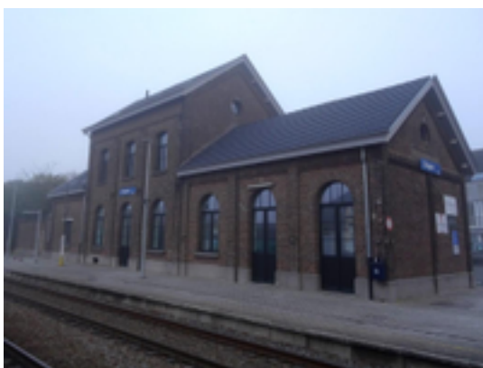
Afbeelding 12: Station Zingem

Station. Typisch plattelandstationnetje op de lijn Gent-Oudenaarde, ingehuldigd in 1857. Eerste stationsgebouw ingeplant ten zuiden van de overweg en de Kruishoutemsesteenweg, voor het