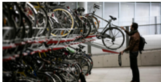
Afbeelding 20: Zingem Fietsenstalling f2

Type: Openbare Fietsenstalling Eigenaar: NMBS Beheerder: B-Parking (NMBS) Publieke toegang: ja Overdekt: -