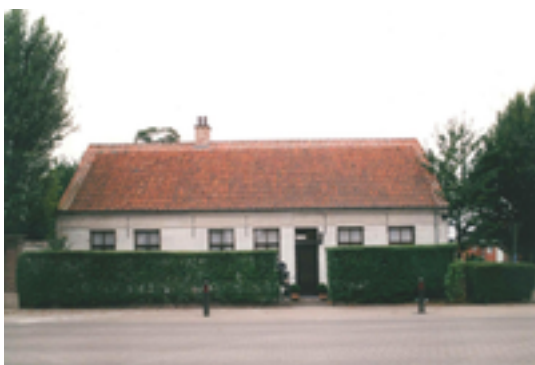
Afbeelding 8: Dorpswoning

Dorpswoning met omhaagde voortuin. Dubbelhuis van zes traveeën onder zadeldak (pannen, nok parallel aan de straat) met sporen van vlechtingen in rechter zijpuntgevel, in kern opklimmend tot de 18de eeuw. Verankerde gewitte voorgevel op gepikte plint en aflijnende beraapte fries tussen geprofileerde lijsten