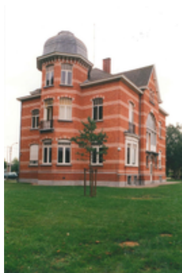
Afbeelding 17: Gemeentehuis Kasteel Amelot